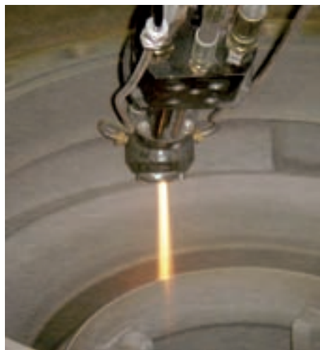
Hochgeschwindigkeitsflammspritz-Anlagen ermöglichen die Innenbeschichtung von schwer zugänglichen Bauteilen.