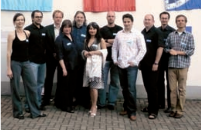
Die Mitglieder des Vereins „51°Nord“ bilden ein Netzwerk von Unternehmen aus der Kreativwirtschaft in der Dortmunder Nordstadt.

Bis zum 20. September 2007 können alle Kooperationen, von denen mindestens ein Partner seinen Sitz in der Dortmunder Nordstadt hat, sich für den mit 6000 Euro dotierten Kooperationspreis 2007 bewerben. Dieser wird vom Innovationszentrum Nordstadt in diesem Jahr zum zweiten Mal vergeben. Preisträger des Vorjahres ist die Radiologische Gemeinschaftspraxis Dr. Kukulies und Kollegen. www.izn-dortmund.de