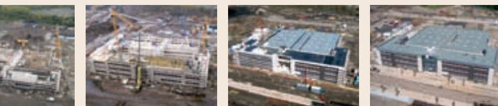
Von August 2007 (Foto li.) bis September 2008 (Foto re.) hat das ZfP Dortmund Gestalt angenommen.