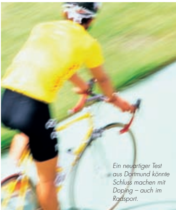
Ein neuartiger Test aus Dortmund könnte Schluss machen mit Doping – auch im Radsport.