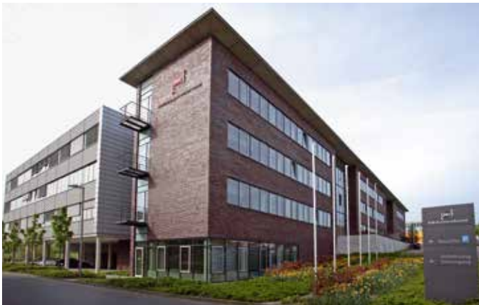
Das BMZ II, Otto-Hahn-Straße 15, wurde vor 10 Jahren eröffnet.