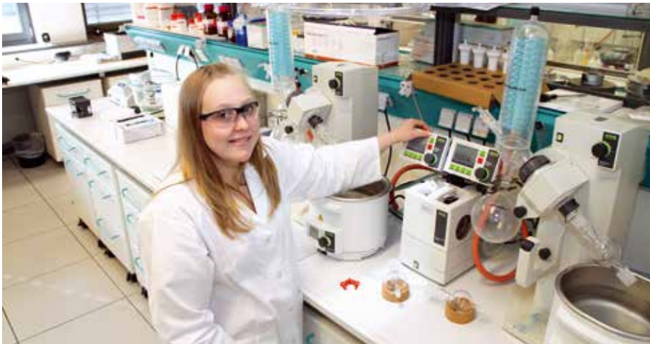
Die Lead Discovery Center GmbH erhält einen Projektzuschuss in Millionenhöhe für die Entwicklung von zwei innovativen Wirkstoffansätzen zur Behandlung von Entzündungskrankheiten und Tumoren.

Zudem bauen LDC und AstraZeneca ihre Partnerschaft zur Identifizierung neuer Medikamente zur Behandlung von Krankheiten mit hohem medizinischen Bedarf weiter aus. Die Partner werden für drei zusätzliche Jahre eng zusammenarbeiten, um neue Projekte in der Onkologie und Neurologie sowie in den Bereichen Herz-Kreislauf-, Stoffwechsel-, Atemwegs- und Entzündungskrankheiten voranzubringen. www.lead-discovery.de