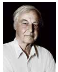
Prof. Dr. Robert Huber, der 1988 den Nobelpreis für Chemie bekommen hat, hält den Festvortrag im BMZ.